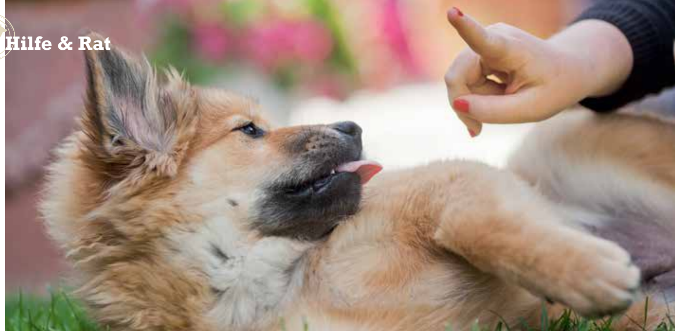
Wer von Beginn an konsequent ist, kann mit seinem Hund später mehr Freiheiten genießen